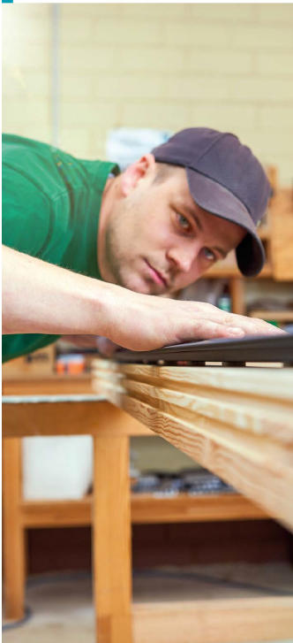
Verantwortungsvoll mit natürlichen Ressourcen umgehen: IDEAL unterstützt den WWF und fördert so einen weltweiten Schutz unserer Wälder.

Im Jahr 2018 hat sich IDEAL dem Netzwerk der Arbeitgebermarke Eifel angeschlossen. Von einem neutralen Auditor des RKW Rheinland-Pfalz wurde IDEAL anhand standardisierter Checklisten beurteilt und zertifiziert. Der Check behandelt schwerpunktmäßig die Themen Mitarbeiter, Kunden, Prozesse, Sicherheit und Standort. Hier stehen Gesichtspunkte wie Familienfreundlichkeit, Führungskultur, Work-Life-Balance u.v.m. im Fokus der Prüfung. IDEAL darf sich nach erfolgreich bestandener Prüfung glücklich schätzen, der erste zertifizierte Eifelarbeitgeber im Landkreis Berncastel-Wittlich zu sein.