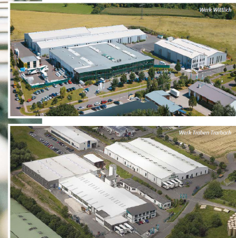
VulkanEifel Heimat hautnah. 55