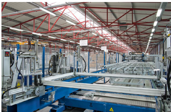
Die bei der Produktion von Kunststofffenstern anfallenden Kunststoffabfälle werden bei IDEAL zu 100 Prozent recycelt.