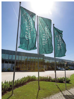
56 VulkanEifel Heimat hautnah.

Der Weg dahin war bestimmt von klaren Werten, klugen Investitionen und der konsequenten Kombination von traditionellem Handwerk mit Hightech-Produkten.