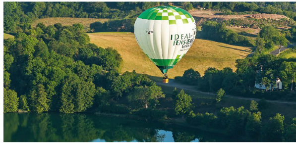
IDEAL erobert den Luftraum: Der neue Heißluftballon wird auf Firmenevents eingesetzt und zeigt auch Kunden die Eifel von oben.

Forciert wurde 2017 auch das Thema Recycling: Im Bereich Kunststoff-Fenster ist IDEAL seit diesem Jahr Premium Partner der Rewindo. So werden Kunststoff-Abfälle zu einhundert Prozent recycelt. Natürlich wird dieses Engagement auch in der Holz-Fensterproduktion umgesetzt.