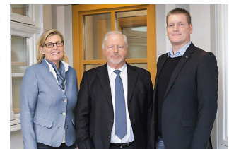
VulkanEifel Heimat hautnah. 57